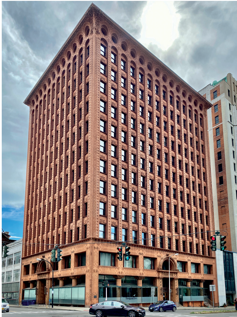
Figura 6: Edificio Prudential

¿Cuál de las siguientes opciones describe mejor el principio de “la forma sigue a la función”?