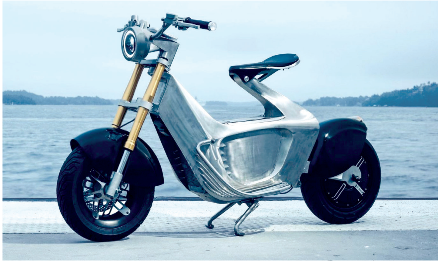
Figura 7: Motocicleta Stilride

La técnica de fabricación utiliza láseres para aplicar un tratamiento térmico muy localizado al acero inoxidable laminado templado. Se centra en suavizar las zonas en las que el material tendrá que doblarse. A continuación, unos robots conforman las chapas laminadas al temple en complejas formas tridimensionales.