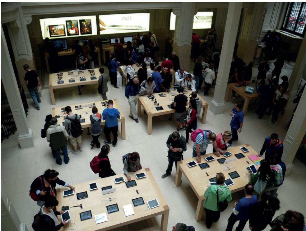
Figura 4: Interior de un Apple Store

¿Cuál de las características de la innovación de Rogers se demuestra en el Apple Store?