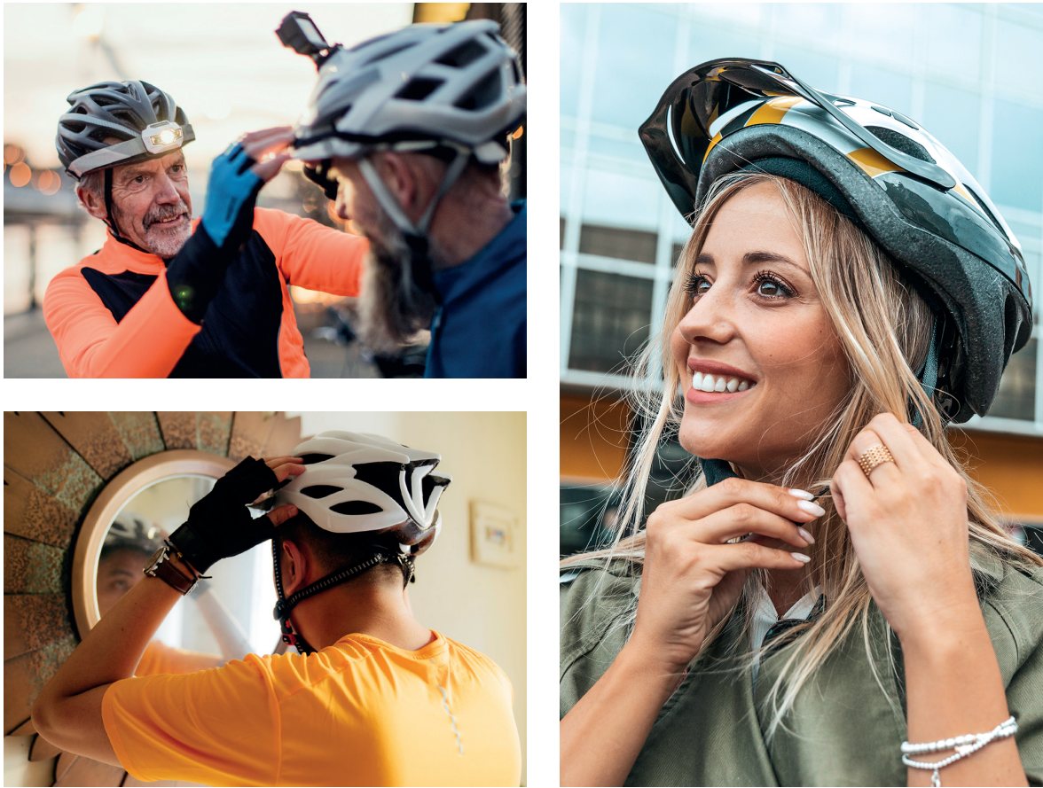
Figura 1: Casco de bicicleta

¿Cuál es la principal consideración a la hora de diseñar un casco de bicicleta para que se ajuste correctamente?