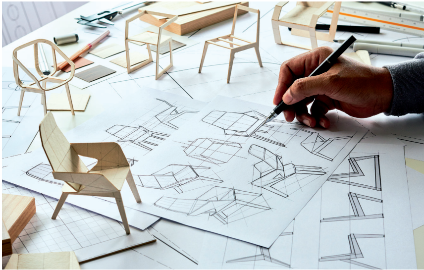
Figura 2: Modelo a escala de una silla

¿Cuál es el propósito de utilizar modelado a escala?