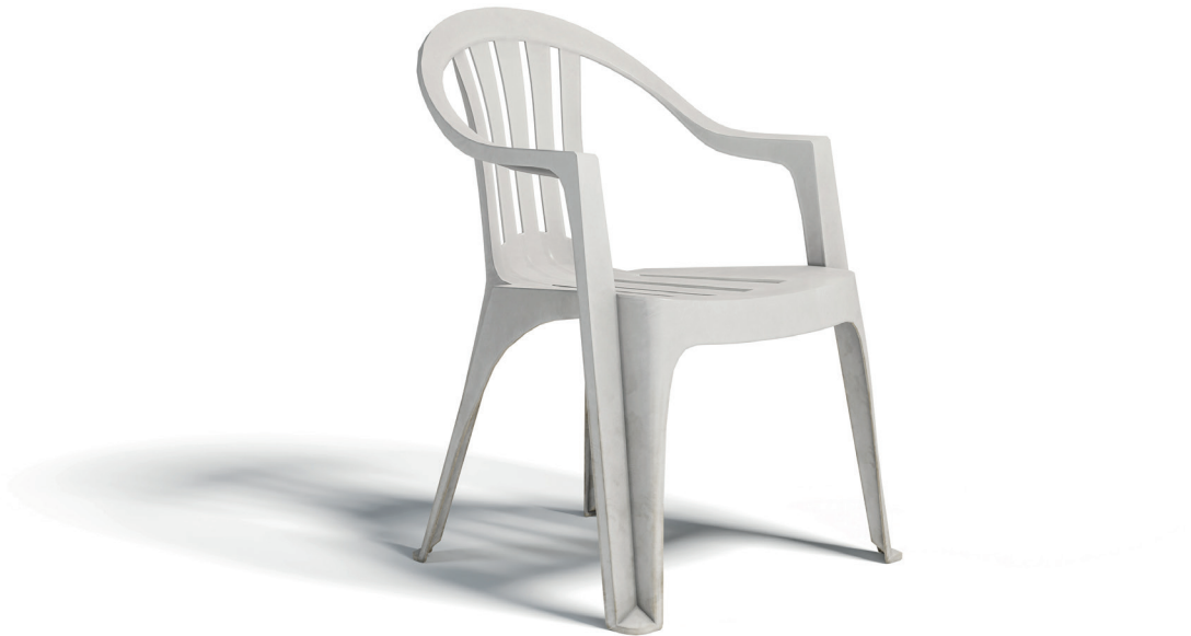
Figura 5: Silla Monobloc